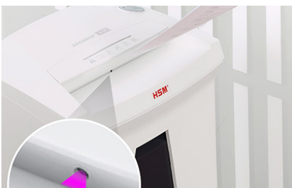
Une cellule photoélectrique