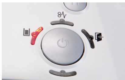
La machine s'éteindra