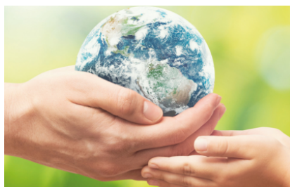
Le destructeur de documents ne