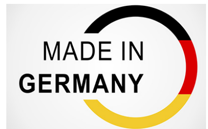
Les matériaux haut de gamme et