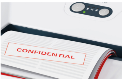
L'insertion du papier avec