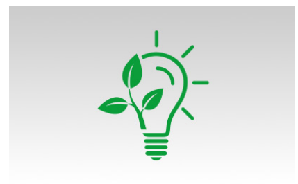
La mise en veille assure un degré