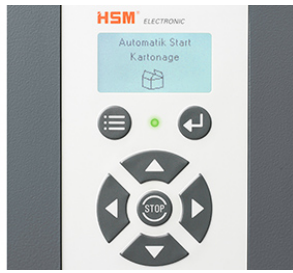
Guide des opérations multilingue avec description graphique