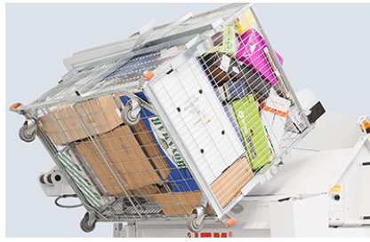
Remplissage confortable et particulièrement rapide grâce à un dispositif de levage et inclinaison hydraulique automatique