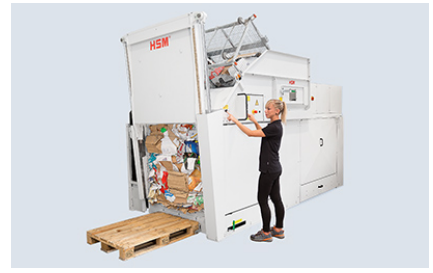
Porte coulissante hydraulique pour l'évacuation des balles pour un confort et une sécurité d'utilisation supérieurs