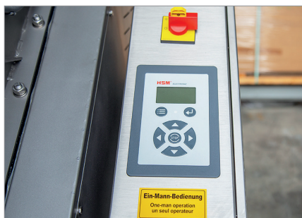
Tableau de commande fonctionnel avec affichage à LED

Idéal comme équipement supplémentaire pour les presses à balles HSM.