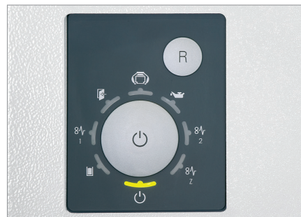
Tableau de commande fonctionnel avec affichage à LED

Le puissant fonctionnement garantit un fonctionnement en continu.