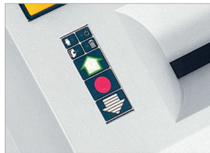
Tableau de commande fonctionnel avec affichage à LED

Le puissant fonctionnement garantit un fonctionnement en continu.