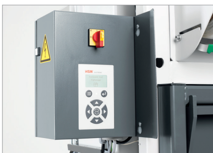
Commande par microprocesseur

Plateau de compactage massif et guidage du plateau extrêmement stable.