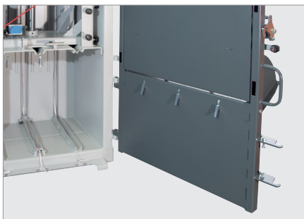
Crochets de retenue

Optimisation du compactage grâce aux crochets de retenue.