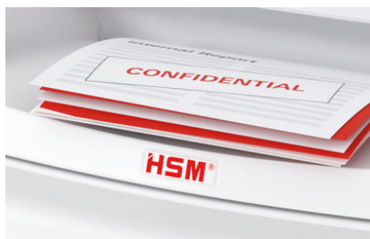
La introducción de papel con