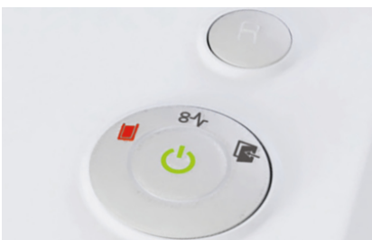
El indicador de la papelera o