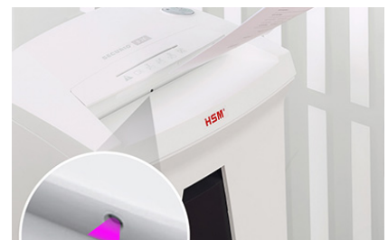
Una célula fotoeléctrica inicia el